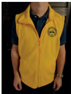
OÖMVC-Gilet: Preis : € 35,00 Größen Damen: 2xM, 5xL, 1xXL Herren: 1xL, 6xXL, 1xXXL