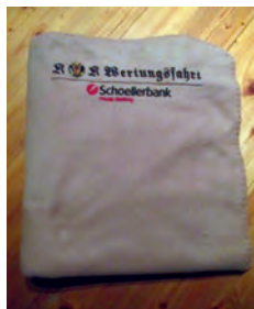
AUTODECKE, braun Preis : € 20,00