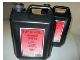
MOTORÖL 15 W 40 5-L-Kanister Preis : € 25,00